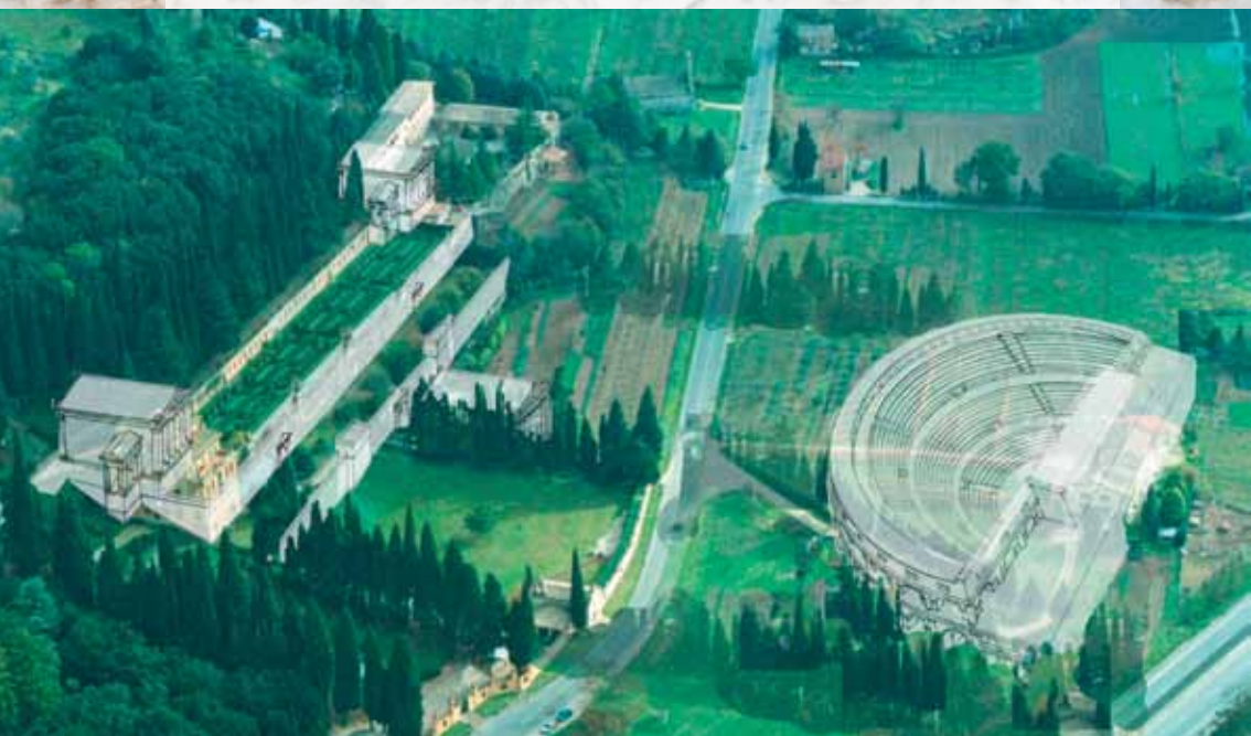
Villa Fidelia: ricostruzione Santuario Federale degli Umbri (P. Camerieri)

Consulenze storico - filologiche a cura del Dott. Andrea Cannucciari e dell'archeologa Sabina Guiducci